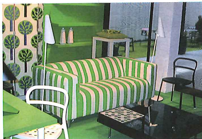
... et le techno vert.