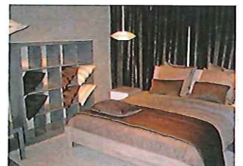
La chambre reste un axe de développement important.