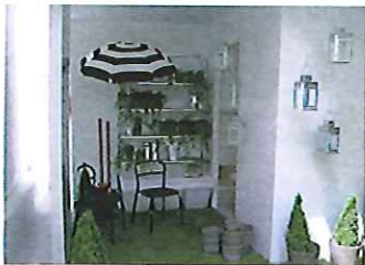
Le jardin n'est pas oublié.