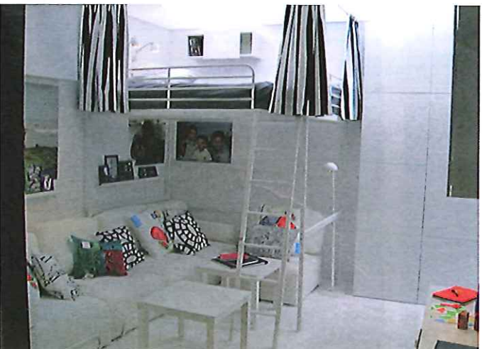
Une proposition sur 58 m2.