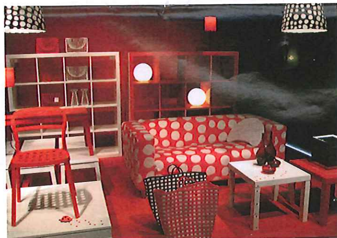
le rouge graphique...