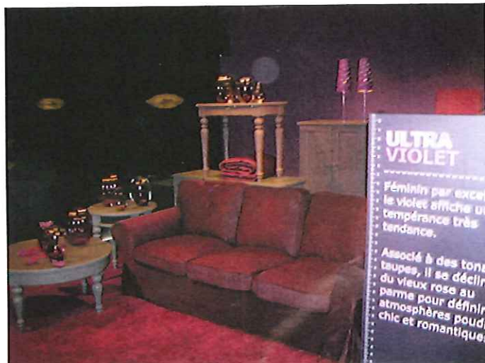
Les trois tendances, mises en avant par Ikea cette année, sont : l'ultra violet ...