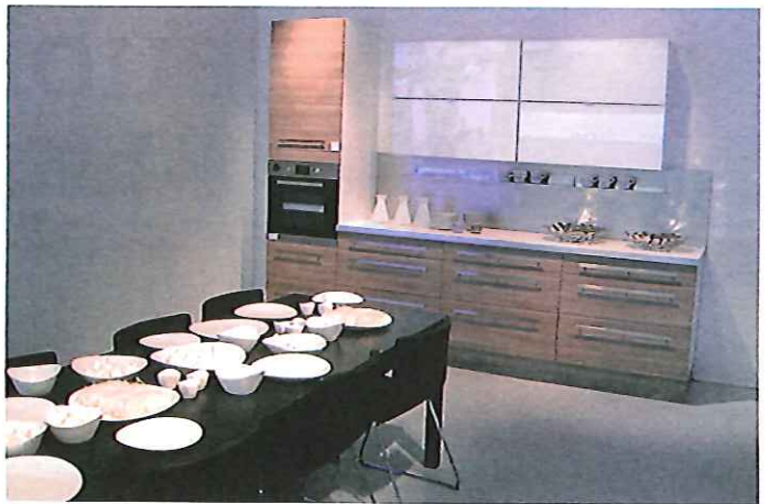
L'une des quatre nouvelles finitions proposées dans l'offre cuisine.